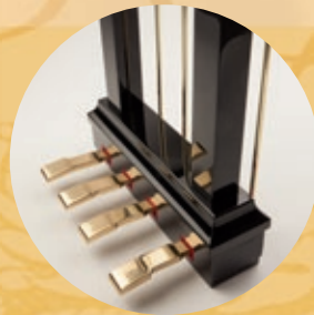
Pédale Harmonique for all grand pianos