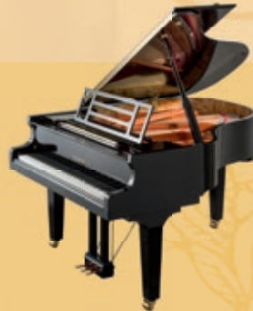
Mod. 179 - Dynamic II