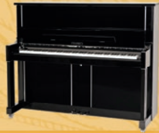
Mod. 125 - Design