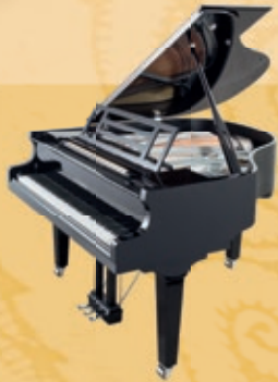
Mod. 162 - Dynamic I