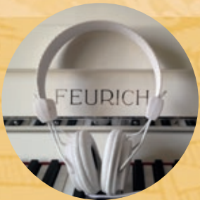
Silencer Systems for all models