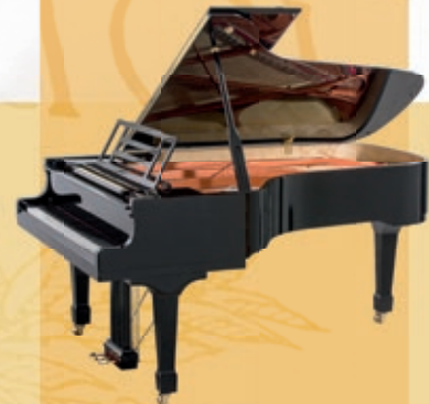
Mod. 218 - Concert I