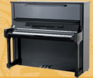
Mod. 133 - Concert